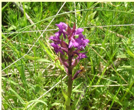
NÁUČNÝ CHODNÍK REMATA